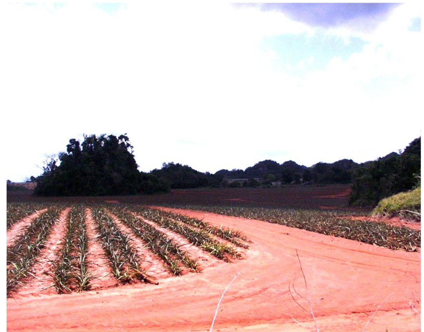
Figura 1. La clasificación de los suelos influye en su uso. En la foto se ilustran las fincas de piña en el municipio de Manatí. Estos suelos consisten de una cubierta arcillosa rica en contenido orgánico (notese al fondo mogotes calizos).

El mapa general de los suelos de Puerto Rico se ilustra en la Figura 4-1. El mapa incluye una descripción de las asociaciones principales descritas en esta sección. El Apéndice 10.3 provee información adicional a la señalada en la Figura 4-1 sobre otras series de suelos menos frecuentes incluidas en el mapa pero no identificadas en su leyenda.